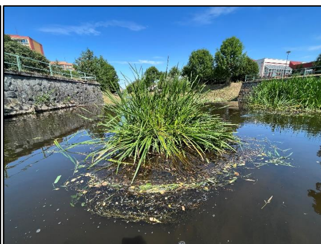
Sediment v nadjezí v rámci SO 01